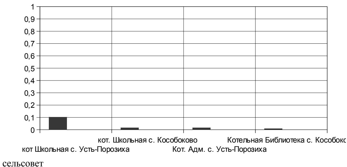
Рис. 2.5.1. Распределение тепловых нагрузок по котельным МО Войковский