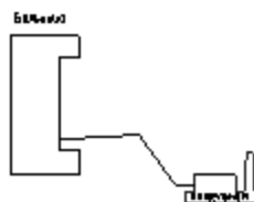
Таблица 2.3.1. Описание тепловой сети котельной Больничная с. Родино