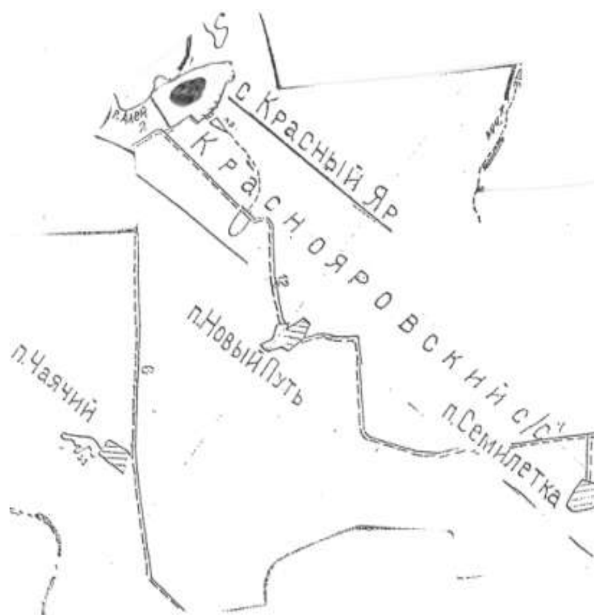
■ Зона действия источника тепла